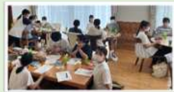
SNSに関する勉強会(新人～3年以下職員参加)