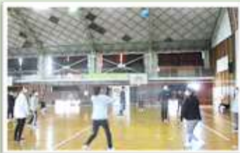
U30?のメンバーでミニバレーを行い 大いに盛り上がりました!