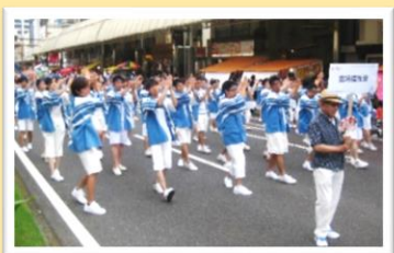
えれこっちゃんみやぎ参加