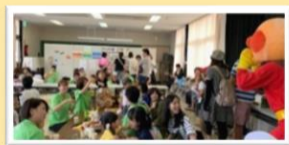
地域福祉まつり参加