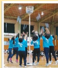
ミニレクレーション