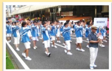
えれこっちゃんみやぎ参加