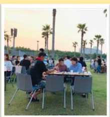
パ-ハ-キュー交流会