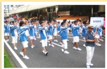
えれこっちゃんみやぎ参加