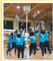
ミニレクレーション