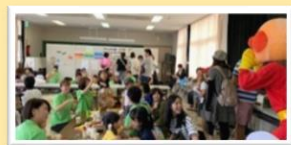
地域福祉まつり参加