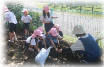
野菜作りは、良質な土作りから!