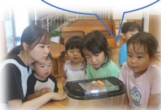
かたつむりさんにエサをあげてみたよ!