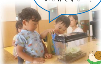
ふかふかの土と葉っぱでお部屋の模様替え☆ かたつむりさんは土の中で卵を産むんだって!