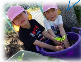
野菜の苗を植えたよ～