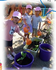
水やりも頑張ってます!