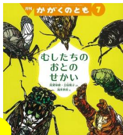
文：高梨琢磨・土原和子 絵：福井 利佐