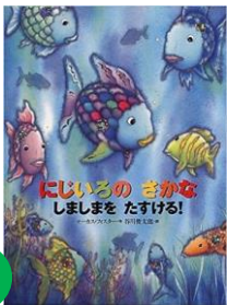
作：マークス・フィスター 訳：谷川俊太郎

(すべて保育園で借りられる絵本です。背表紙のシールの色と合わせてご覧ください。)