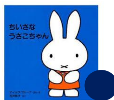
ちいさな うさこちゃん 文・絵：ディックブルーナ 訳：いしい ももこ

○描いた絵本はすべて正方形の 「小さな子どもの手や体のサイズに 丁度いい大きさと形を」 と重視して作られています。