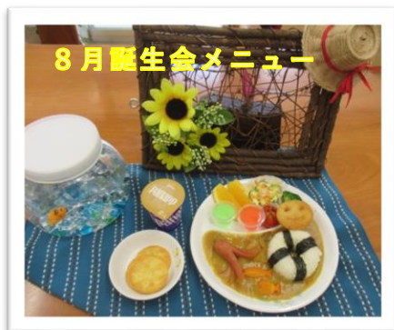
8月誕生会メニュー