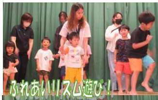
ふれあいリズム遊び!