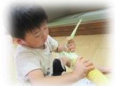
とうもろこしの皮むきも頑張りましたヨ!