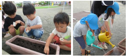
『ちょうちんかずら』や『ひまわり』の種をまきました。花が咲くのを楽しみにしている子ども達です。