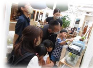
元気に遊ぼうエイエイオー

←保育園で育てている「ツマグロヒョウモン」の幼虫や羽化した姿も見てもらえ、とても喜んでいました。「元気でね～」と手を振り、お空に飛んでいった蝶は「28頭」になります