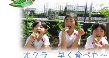
オクラ 早く食べた～い