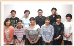
イベント企画委員メンバー