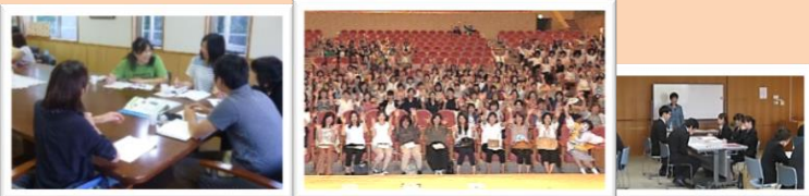
広報誌発行打合せ会 法人内研修 (全体研修・新人研修他)