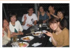
全体打上げの様子