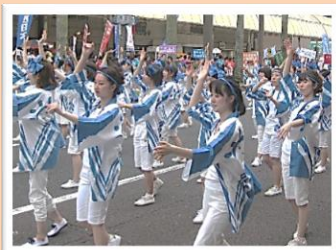
えれこっちゃんやぎき参加