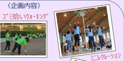
〈企画内容〉 ゴミ拾いウォーキング