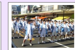
えれこっちゃんみやぎ参加