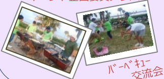
バーバキュー交流会