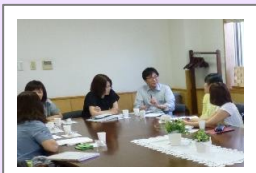
広報誌発行打合せ会