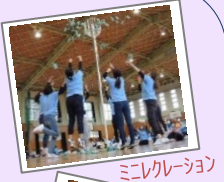
ミニレクリエーション