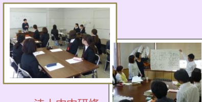
法人内研修 (新人研修・中堅研修他)