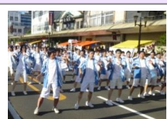
えれこっちゃんみやぎ参加