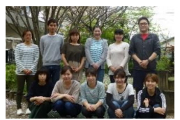
イベント企画委員メンバー