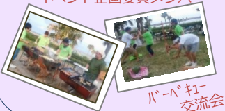
バーベキュー交流会