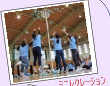
ミニレクリエーション