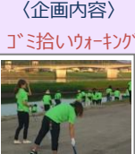
〈企画内容〉 ゴミ拾いウォーキング