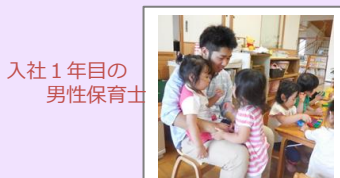
入社1年目の 男性保育士