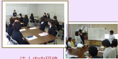
法人内研修 (新人研修・中堅研修他)