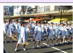
えれこっちゃんやぎ参加